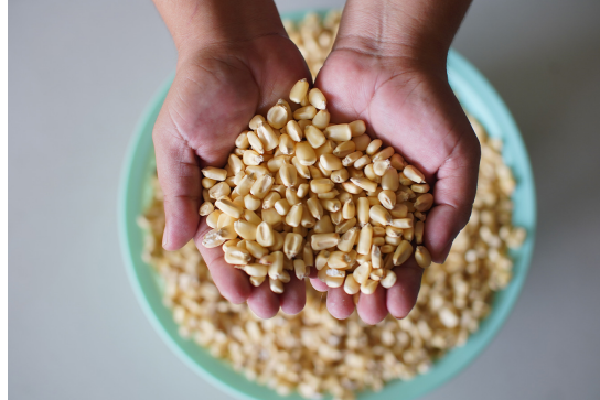
Maíz blanco con el que elaboran las tortillas