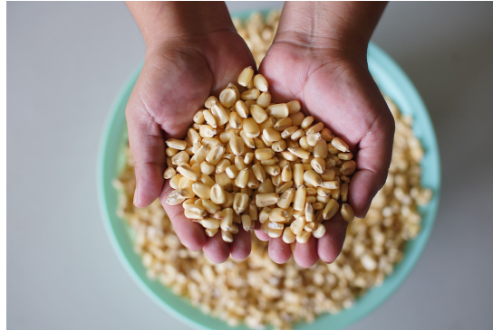
Maíz blanco con el que elaboran las tortillas